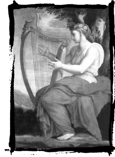
*KALLIOPE, Muse der Schönstimmigkeit und der Dichtkunst

Deine authentische Schreibstimme ausdrücken – Deine Berufung im Schreiben finden